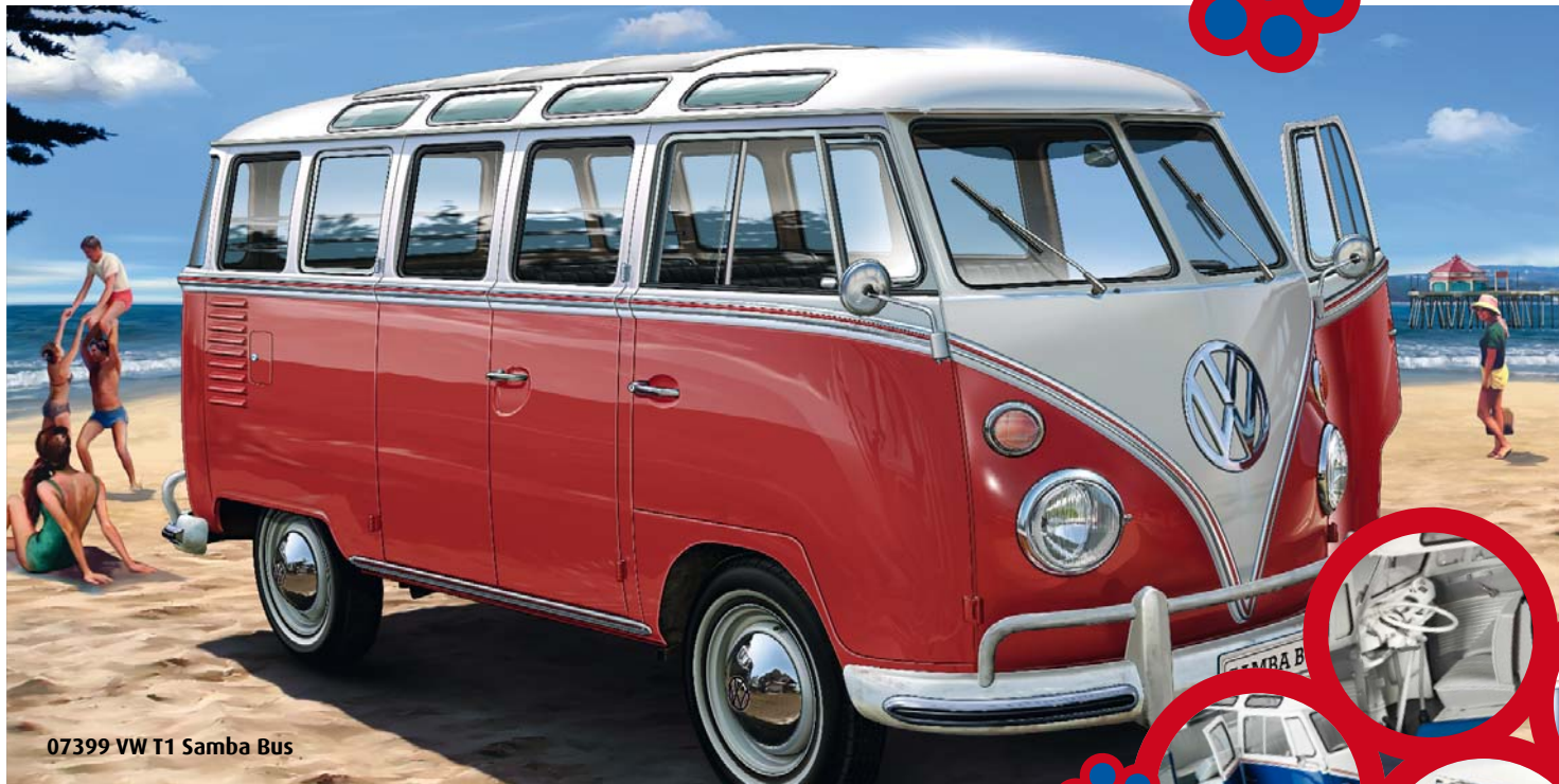
07399 VW T1 Samba Bus